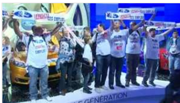
Les ex-Ford ont investi les stands du Mondial France 3