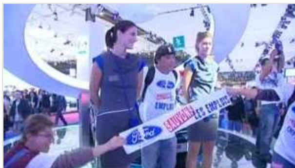
Action des anciens salariés de Ford-Blanquefort au salon de l'automobile à Paris, le 2 octobre 2010.

Ford Europe a présenté lundi aux partenaires sociaux de son ex-usine de Blanquefort deux nouveaux projets industriels.