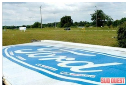
Le panneau de 32 mètres carrés gît sur le sol depuis vendredi. À partir d'aujourd'hui, il est découpé en morceaux.

Vendredi, 16 h 10, ils sont tombés à terre. Après un long week-end d'agonie au sol, le grand panneau Ford et son mât vont être découpés au chalumeau à partir de ce matin.