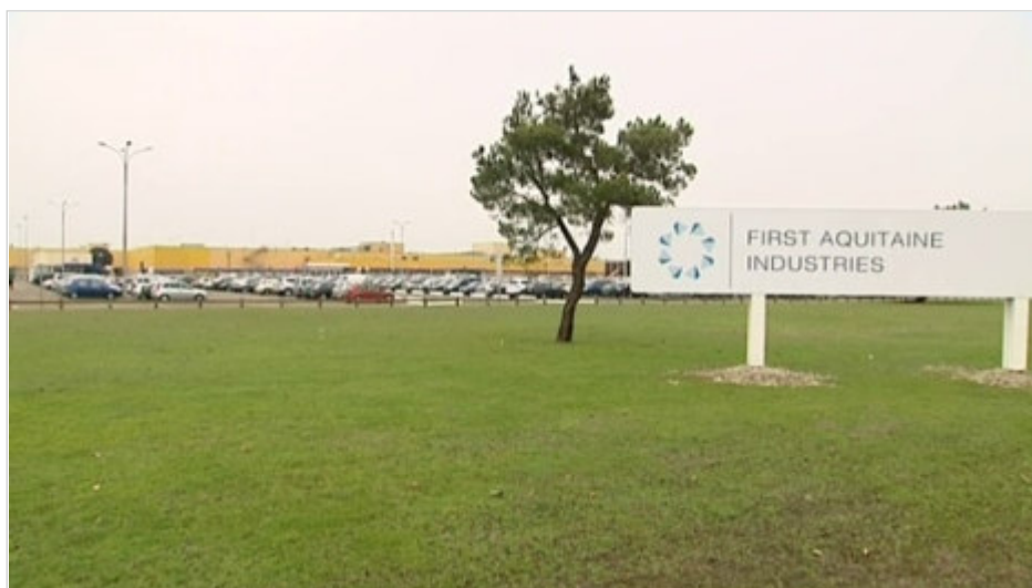
First Aquitaine Blanquefort (33).

La direction a présenté un projet "hypercompétitif" devant les représentants de l'Etat et les collectivités locales.